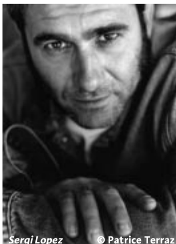
Sergi Lopez

► HORS COMPÉTITION "sélection des Antipodes" (salle 3) : 14h, 16h, 17h, 20h Réservation obligatoire auprès de l'office de tourisme au 04 94 51 83 83