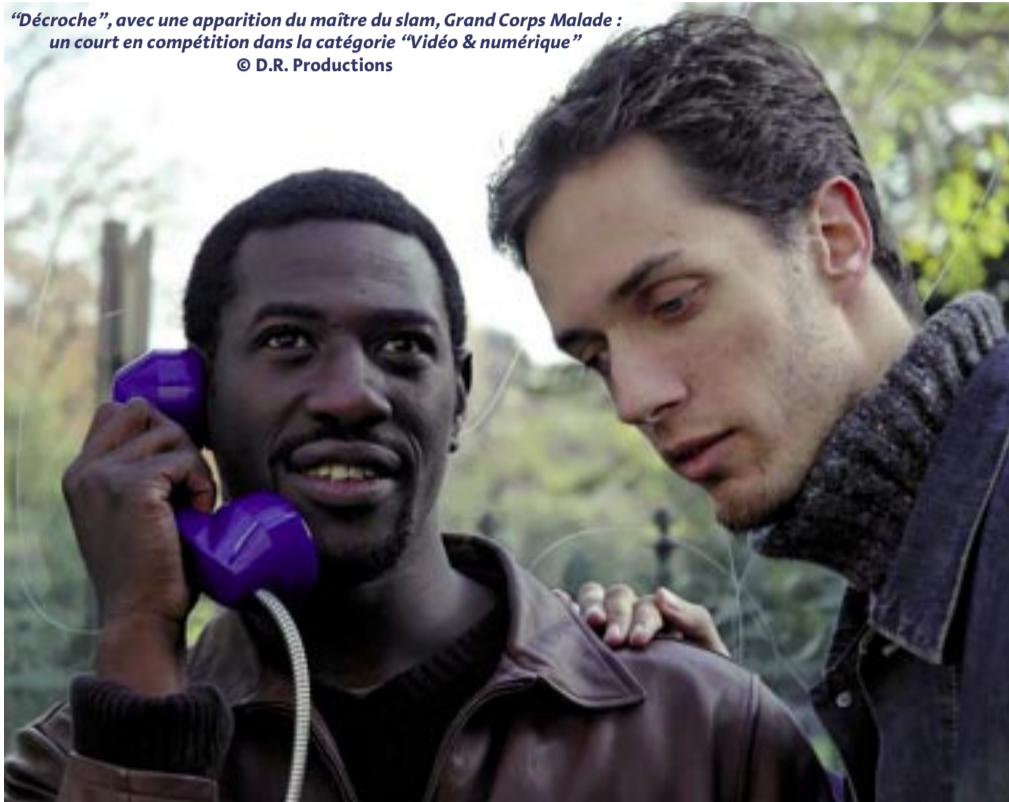
"Décroche", avec une apparition du maître du slam, Grand Corps Malade : un court en compétition dans la catégorie "Vidéo & numérique"

À la tête du jury cette année, une autre personnalité du 7 e art, puisqu'il s'agit de Bob Swaim, réalisateur de "La balance" en 1982, qui permit en son temps à un certain Philippe Léotard de laisser transpercer tout son talent aux côtés de Nathalie Baye et d'une pléiade de jeunes acteurs. Un bel hommage à un acteur-chanteur-poète qui a d'ailleurs laissé son nom au théâtre romain.