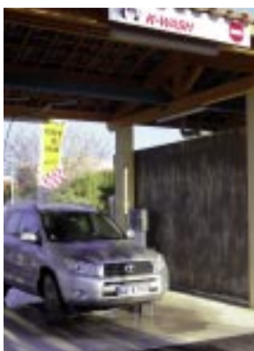
Renseignements et rendez-vous au 04 9419 44 52

Saviez-vous que six voitures sur dix ne sont pas régulièrement lavées par leurs propriétaires ? Installée depuis le 1 er octobre, au 9, rue des Campanettes, face à la base nature et la rue des Batteries, "K-WASH", enseigne déjà implantée sur 250 autres sites en France, propose une nouvelle sorte de lavage : plus efficace, plus économe, plus écologique. Les quatre pistes de ce nouveau genre de centre de lavages - classé 1 er (sur 9 testés) par un célèbre magazine auto - misent sur un matériel performant, de qualité et soucieux de l'environnement, en matière de gestion de l'eau notamment.